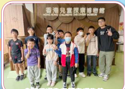
參觀香港兒童探索博物館