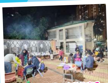
共融家庭燒烤樂、少數族裔及本地家庭一同交流及分享美食