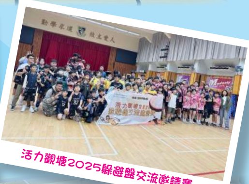
活力觀塘2025躲避盤交流邀請賽