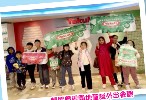
輕鬆學習園地聖誕外出參觀