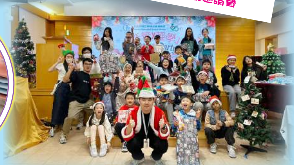
託管服務×輕鬆學習園地 聖誕派對